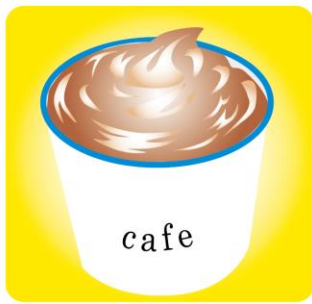
ホイップは、絞り袋に入れてソフトクリームみたいに絞ると、見た目も素敵♪