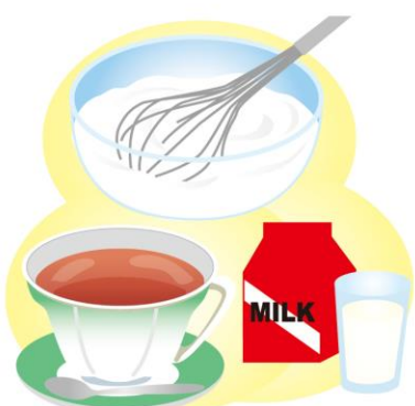
各材料の量は、お好みで調整してくださいね。

● メープルナッツ ：つくっておけば、いつものコーヒーのお供にもなりますし、砕いてカフェドリンクの上にかければナッツのアクセントが加わりより美味に♪見た目も良いですよ。