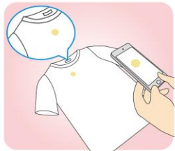
シミなどがあつたらそれをアップで撮り、正直に申告することも大切。後のトラブル防止になります

にくいのでご注意ください。照明は、白熱灯なら黄色っぽく、蛍光灯なら青っぽく写ることがあるので、その旨ひとこと添えると親切です。 靴は、内側や使用感が出やすい靴裏をキレイに拭き、横に倒したヒール部分、甲部分、靴裏などの全体のデザインを撮影します。食器も表と裏の全体のデザイン、特徴的な部分のアップを撮ると良いですね。使いかけの化粧品も瓶の口などをキレイに拭き、容器の表や成分表示、使いかけがわかる部分の撮影を。