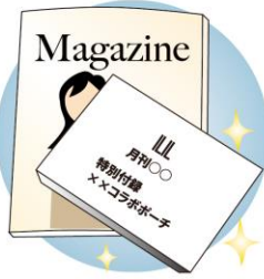
読み終わった雑誌や未使用の付録も意外と売れます♪最新号のものがおすすめです

からです。たとえば、洋服はハンガーにかけて、まっすぐにハンガーラックやドア枠などのところに引っかけます。前身頃と後ろ身頃の全体を正面から撮影し、襟など特徴的なデザインやブランドのタグはアップで撮影します。フレアスカートなら、床に広げて撮るのもおすすめです。