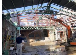
重機が入りがつり解体作業中！