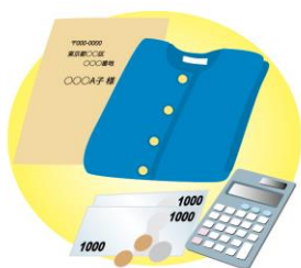
価格は、送料込みで出品するパターンが多く、手数料も引かれるので、その分も考慮して決めると良いですよ

文章は、○○(ブランド名)のブラウスです。などに入れ、デザインの特徴:たとえば、「襟のフリルがかわいいです」といったアピールをすることもおすすめです。また、どれくらい前に購入し、使用頻度や素材(綿100%など)を入れるとより分かりやすいです。さらに、サイズはS、M、Lなどありますが、実際に洋服を広げて着丈や身頃の幅、袖の長さ、肩幅、胸幅、股下を測って、紹介文に書き加えましょう。食器なら直径や深さ