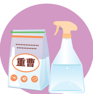
重曹水も菌の繁殖を抑えるので玄関床におすすめ！水500mlに対して大さじ1の重曹を混ぜれば完成です

押し入れは、閉めっぱなしがいちばんのNG！ときどき戸を開けて、扇風機などで風を通すだけでもかなり効果があります。布団をしまうときは、すのこを床と壁に置くことで、空気の通り道ができて湿気がこもりにくくなります。洋服を掛けている場合は、乾燥剤や除湿剤を置くこともおすすめです。皮革製のバッグなどは不織布のカバーに入れて間隔を空けて収納しましょう。