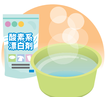
酸素系漂白剤は40度のお湯で効きめを発揮するといわれていますが、分量や湯温は表示を見て使しましょう

洗面室は洗面台や洗濯機があり、脱衣所も兼ねると、湿気がこもり、壁紙などにカビが生えることも。ときどき窓や戸を開けて風を通し、壁や床が濡れたらすぐ拭きましょう。洗面ボウルは、1日の最後に中性洗剤で洗い、キッチンペーパーなどで拭くと、翌朝、気持ちよく使えます。洗濯機に脱いだ洋服を入れっぱなしにするのはNG！湿気がこもり、雑菌が繁殖して洗濯槽がカビの温床に。