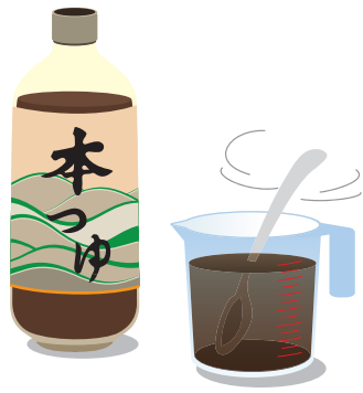
濃縮タイプは表示の量で薄めた方が使いやすいです。

みなさまに暮らしと住まいを快適にするためのちよつと役立つ情報をお届けいたします。今回のテーマは「めんつゆの活用法」です。文字通り、麺類に大活躍しますが、だしとしょうゆベースの味わいは日本人になじみ深いので、いろいろな料理にアレンジできます。食材の量はお好みで、めんつゆや調味料の量は、加減をみながら調整してくださいね。