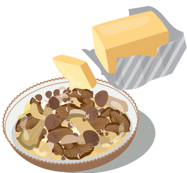
バター&めんつゆはきのことも相性バッチリです！

めんつゆで和風グラタンはいかが？とうふと合わせればちよつとポリリウムのある一品に仕上がります。とうふをめんつゆで2〜3分煮て味をしみこませます。煮たとうふと煮汁のめんつゆ少量を耐熱皿に移し、きのこなどお好みの具材を入れ、上からとろけるチーズやピザ用チーズを乗せてオーブントースターで焼くだけ。オーブントースターの焼き時間は、チーズのこんがり具合など、