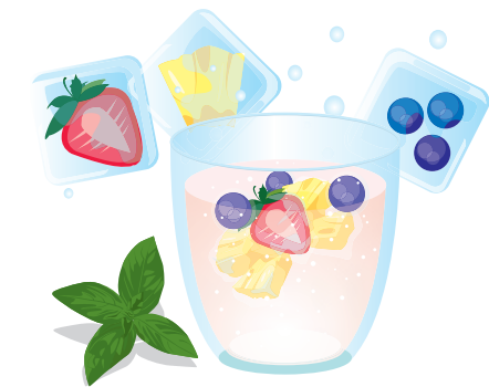
ハーブや果物を入れた氷は炭酸水に入れるとよ り華やかさが増します♪

方もあります。それが「ハーブ水」。 水500mlに対し、ハーブ5g程度 (お好みで増減してください)を入 れ、冷蔵庫で1〜2時間置けば、で きあがりです。いちばんポピュラー なのがミントですが、ローズマリー もおおすすめです。水の中にローズマ リーの葉を入れるだけ。爽快な香り のローズマリー水のできあがり。朝 飲むとシャキッとします。ローズマ リー水にレモンの輪切りを加えれ ば、さらにさわやかさがあまります。 レモンバーム水の香りには気分を晴 れやかにしてくれる効果があるの で、疲れたときの気分転換にぴった りです。さらに、しそ(大葉)もお すすめ。単体でつくるより、みかん やレモンなど、柑橘系と合わせると、 香り豊かで色も華やか。料理のお口 直しにも良いですよ。