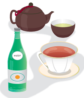
香りを楽しむ中国茶や紅茶 は硬水がおすすめ♪

飲みものについては、緑茶は硬水 だと香りが良く、旨みは抽出されに くくなり、軟水だと旨みが良く出て、 香りは控えめになります。コーヒー も硬水だと苦みが強く、軟水だと豆 によって酸味やまろやかさが感じら れるようです。一度同じ品種で飲み 比べてみるのも楽しいですね。